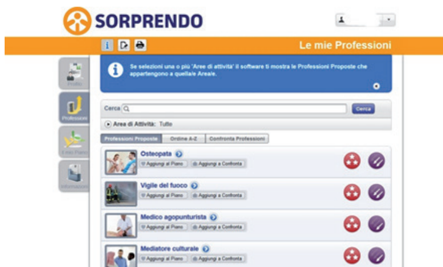
Immagine che rappresenta i profili di alcune professioni